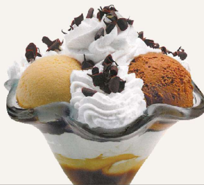
Coupe Vesubio 3/6 ..... 6,60 €

Boule à la fraise, vanille et citron, des morceaux de fruits au sirop avec chantilly.