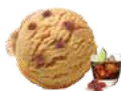
Raisin au rhum