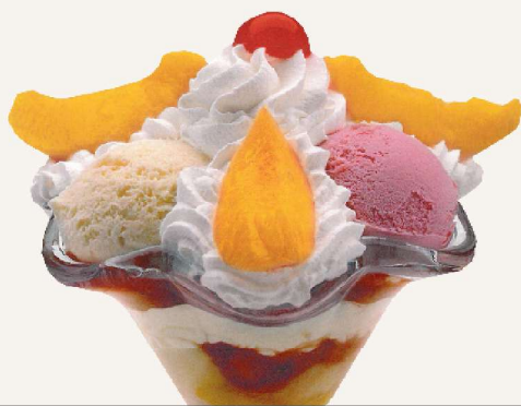
Coupe Bali 3/6 ..... 6,60 €

Boule à la vanille, fraise et pistache, le tout arrosé d'un coulis à la fraise.