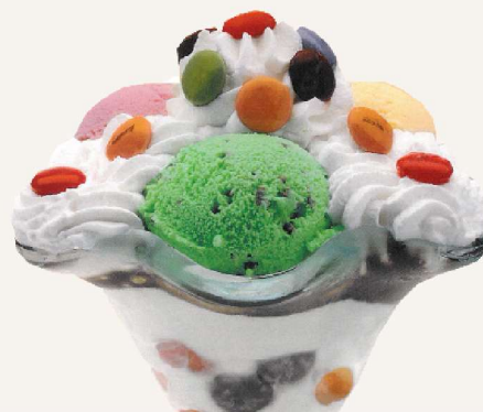
Coupe Lacasitos 3/6 ..... 6,60 €

Boule de pistache, fraise et citron, avec des morceaux de cerise au sirop avec chantilly.