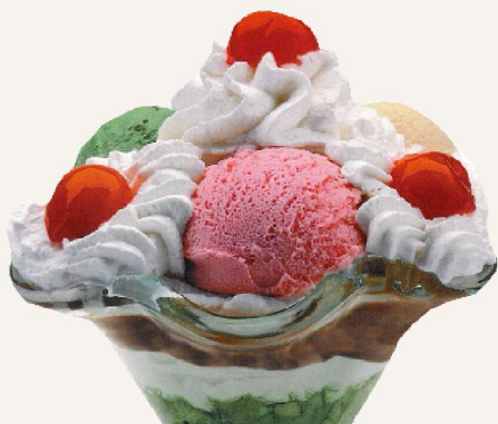
Coupe Alaska 3/6 ..... 6,60 €

Boule de pistache, fraise et citron, avec des morceaux de cerise au sirop avec chantilly.