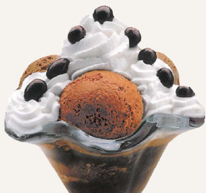
Coupe Conguitos 3/6 ..... 6,60 €

Boule de vanille, nougat et café à la chantilly, tout arrosé d'un coulis de caramel.