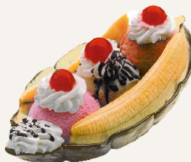
Banana Split 3/6 ..... 6,60 €

Boule de chocolat avec chantilly, le tout arrosé d'un coulis à chocolat.