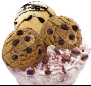
Liégeois kafe ..... 6,60 € Banillazko izozkia eta 2 kafe-bola.