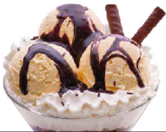
Dama Blanca ..... 6,60 € Konbinazio perfektua banillazko izozkiarekin eta txokolate beroarekin.