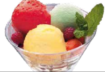
Sorbete ..... 6,60 € Limoi, mugurdi eta sagar berde freskagarriak.