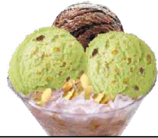
Xabi kopa ..... 6,60 € Txokolatearen eta pistatxoaren konbinazio klasikoa.