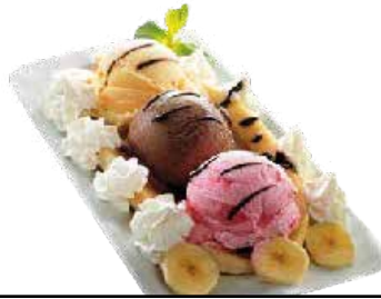
Banana Split ..... 6,60 € Banillazko, txokolatezko eta marrubizko izozkia, banana eta esne gain muntatuarekin.