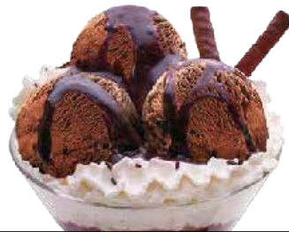
Liégeois txokolatea ... 6,60 € Txokolate goxoa.