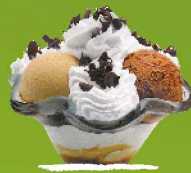
VESUBIO Banilla, turroia eta txokolate esne-gainarekin, dena karameluz bustita. 3/6/8