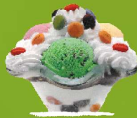
LACASITOS Banilla, marrubi eta pistatxo bola, esne-gainarekin dena marrubiz bustita. 3/6/8