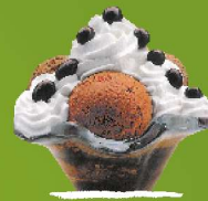
CONQUITOS Txokolate bola esne-gainarekin, dena txokolatez bustita. 3/6/8