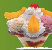
BALI Marrubi, banilla, limoi bola, fruta puska karamelizatuak eta esne-gaina. 3/6/8