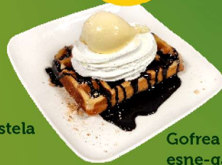
Gofrea izozki, esne-gaina eta txokolatearekin. 1/3/6/8/12