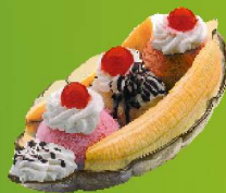
BANANA SPLIT Banilla, marrubi eta txokolate bola, banana puskekin, txokolatez bustita. 3/6/8