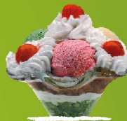
ALASKA Pistatxo, marrubi eta limoi bola, gerezi karamelizatuekin eta esne-gainarekin. 3/6/8