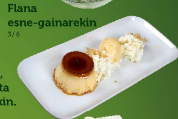
Flana esne-gainarekin 3/6