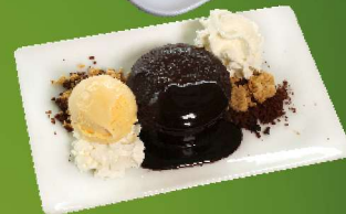
Txokolate Fondanta 1/3/6/8/12