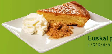
Euskal pastela 1/3/6/8/9