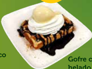
Gofre con helado, nata y chocolate. 1/3/6/8/12