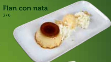
Flan con nata 3/6