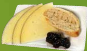
Queso de oveja 6