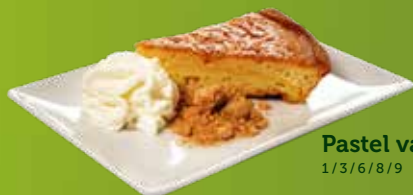
Pastel vasco 1/3/6/8/9