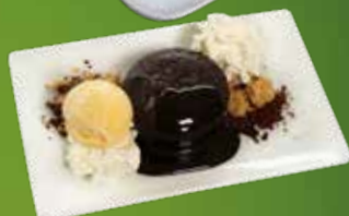
Fondant de chocolate 1/3/6/8/12