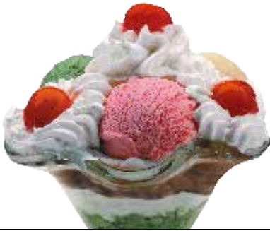
Alaska kopa . . . . . 6,60 € 3/6/8

Pistatxo-, marrubi- eta limoi-bola, gerezi zati karamelizatuarekin eta esnegainarekin.