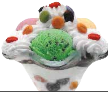
Lacasitos kopa . . . . . 6,60 € 3/6/8

Txokolatezko bola esnegainarekin, dena txokolatez bustita.