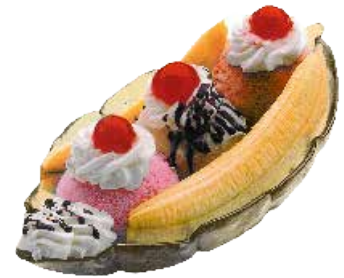
Banana Split . . . . . 6,60 € 3/6/8

Banilla bola, turroia eta kafea esnegainarekin, dena karameluz blai.