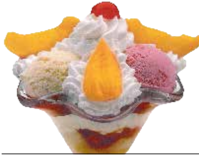
Bali kopa . . . . . 6,60 € 3/6/8

Pistatxo-, marrubi- eta limoi-bola, gerezi zati karamelizatuarekin eta esnegainarekin.