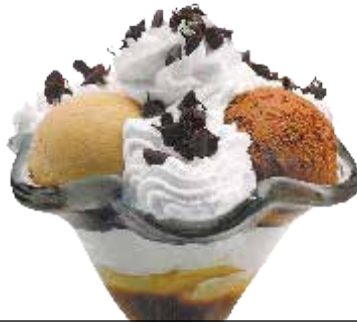
Vesubio kopa . . . . . 6,60 € 3/6/8

Banilla, marrubi eta pistatxozko bola, dena marrubiaz bustita.