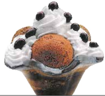
Conguitos kopa . . . . . 6,60 € 3/6/8

Marrubi, banilla eta limoizko bola, fruta puska karamelizatu eta esnegaina.