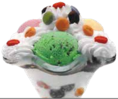
Lacasitos kopa . . . . . 6,00 1/5/6/8/9/12

Txokolatezko bola esnegainarekin, dena txokolatez bustita.