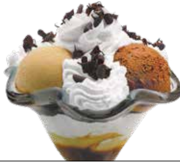
Vesubio kopa . . . . . 6,00 1/5/6/8/9/12

Banilla, marrubi eta pistatxozko bola, dena marrubiaz bustita.