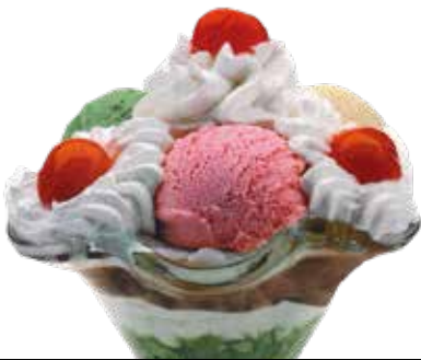
Copa Alaska ..... 6,00 1/5/6/8/9/12 Bola de pistacho, fresa, limón y trozos de cereza en almíbar y nata.