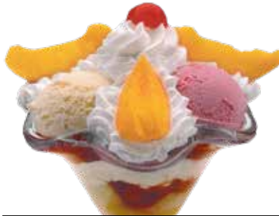
Copa Bali ..... 6,00 1/5/6/8/9/12 Bola de fresa, vainilla, limón y trozos de fruta en almíbar con nata.