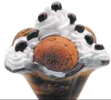
Copa Conguitos ..... 6,00 1/5/6/8/9/12 Bola de chocolate con nata, todo decorado con un delicioso coulis de chocolate.