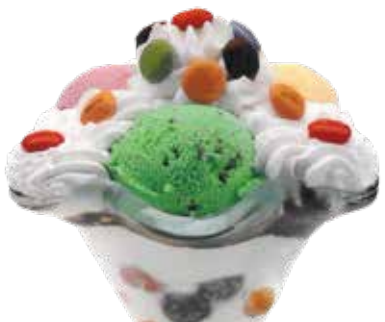
Copa Lacasitos ..... 6,00 1/5/6/8/9/12 Bola de vainilla, fresa y pistacho. Todo regado con un coulis de fresa.