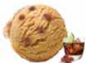
Pasas al ron