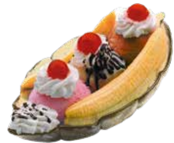
Banana Split ..... 6,00 1/5/6/8/9/12 Bola de vainilla, fresa y chocolate, con trozos de cerezas y plátano, decoradas con salsa de chocolate.