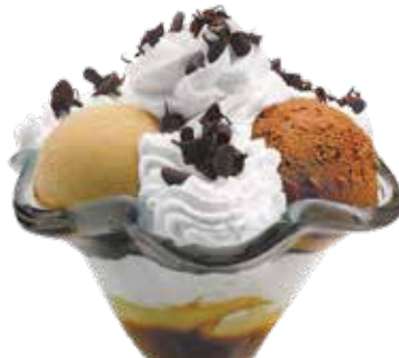
Copa Vesubio ..... 6,00 1/5/6/8/9/12 Bola de vainilla, turrón y chocolate con nata. Todo regado con un delicioso coulis de caramelo.