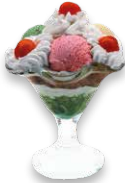
Copa Alaska 1/5/6/8/9/12 ..... 6,00

Bola de pistacho, fresa, limón y trozos de cereza en almíbar.