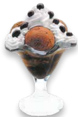
Copa Conguitos 1/5/6/8/9/12 ..... 6,00

Bola de fresa, vainilla, limón y trozos de fruta en almíbar con nata.