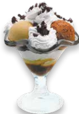
Copa Vesubio 1/5/6/8/9/12 ..... 6,00

Bola de vainilla, fresa y pistacho. Todo regado con un coulis de fresa.