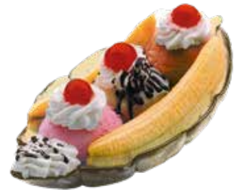
Banana Split 1/5/6/8/9/12 ..... 6,00

Bola de vainilla, turrón y chocolate con nata. Todo regado con un delicioso coulis de caramelo.