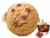
Pasas al ron