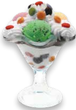
Copa Lacasitos 1/5/6/8/9/12 ..... 6,00

Bola de chocolate con nata, todo decorado con un delicioso coulis de chocolate.