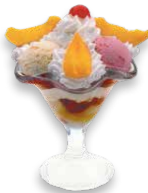
Copa Bali 1/5/6/8/9/12 ..... 6,00

Bola de pistacho, fresa, limón y trozos de cereza en almíbar.